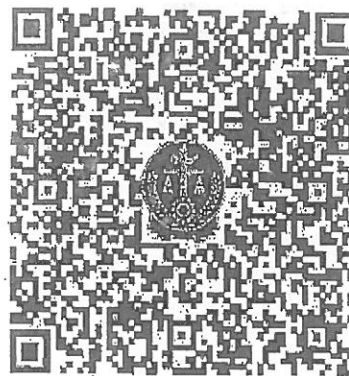
“集资参与者信息登记核实系统”二维码